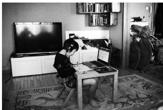
2021 оны 4 дүгээр сар. Зайнаас хичээллээд хагас жил болсон сурагч

Манай улсын хувьд зайн сургалтыг 2000 оны эхэн үеэс хөгжүүлж, 2002 оноос "Зайн сургалтын үндэсний хөтөлбөр," 2005-2012 оны хооронд хэрэгжүүлсэн "Цахим Монгол үндэсний хөтөлбөр," 2012-2016 оны хооронд "Нэг Монгол санаачилга" зэрэг хөтөлбөрүүд хэрэгжүүлсэн боловч нийтээр зайны сургалтад шилжих шийдвэр гарах үед суралцагчдын эрэлт хэрэгцээг