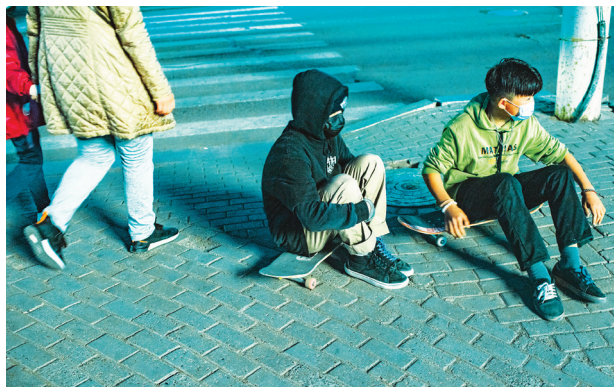
2021 оны 5 дугаар сар. Сүхбаатрын талбай. Ангийн найзуудын уулзалт (Зургийг Б.Тамир)

Өмнө дурдсанаар улс оронд цар тахал дэгдээгүй байх үед хичээл, сургалтын биечилсэн үйл ажиллагааг сөрөг үр дагаврыг тооцолгүй, судалгаа шинжилгээнд үндэслэлгүйгээр улс төрийн шийдвэрээр зогсоов. Гэтэл дэлхийн улс орнууд хамгийн сүүлийн мөч хүртэл сургалтыг зогсоохгүй байх, зогсоосон ч аль болох богино хугацаанд авч хэрэгжүүлэх буюу дасан