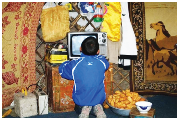
Малчин өрхийн хүүхэд ТВ хичээл үзэж буй нь (Эх сурвалж www.gogo.mn )

БШУЯ-ны мэдээгээр гэр бүлийн орчинд нь дэд бүтэц, интернэт, гэрэл цахилгаан, техникийн боломж нөхцөл бүрдээгүйн улмаас 330 сумын 172,300, 46 багийн 6277, нийт 178,577 суралцагч теле хичээлд хамрагдаж чадаагүй 17 бөгөөд Багшийн мэргэжил дээшлүүлэх институтийн тайланд теле хичээлд хамрагдсан сурагчдын ирц улсын хэмжээнд дунджаар 81 хувьтай 18 гэж дүгнэсэн байна. Харин НҮБ-ын Хүүхдийн сангаас өнгөрсөн хагас жилийн хугацаанд дунджаар нийт сурагчдын 21 хувь нь ямар нэг шалтгаанаар теле хичээлээ огт үзээгүй гэдэг дүгнэлтийг хийжээ.